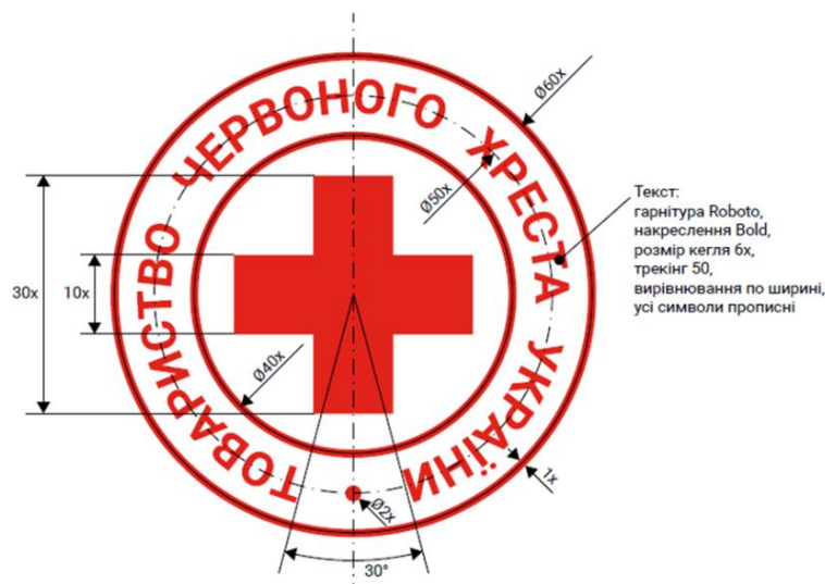
Схема пропорцій логотипу / Logo Proportions Guide

* Захисна зона логотипу — це мінімальна допустима відстань від логотипу до найближчих об'єктів дизайну або верстки.