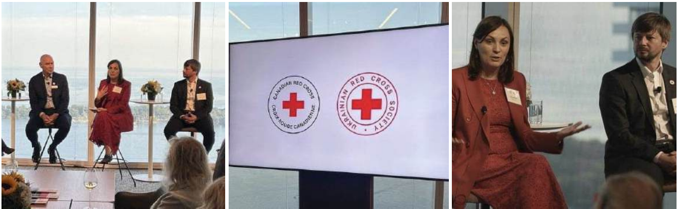
Благодійний вечір «Партнери у гуманності: вечір з Українським Червоним Хрестом». Вересень 2024, Торонто.

Генеральний директор Українського Червоного Хреста Максим Доценко разом з президентом Канадського Червоного Хреста Конрадом Сове та послом України в Канаді Юлією Ковалів розповів про війну та гуманітарну ситуацію в Україні. Вони також обговорили виклики прийдешньої зими, які ускладнюються постійними обстрілами, зокрема енергетичної інфраструктури. УЧХ та Канадський Червоний Хрест висловили вдячність українській діаспорі у Канаді за допомогу та сприяння у проведенні заходу, та закликали до скоординованого постійного реагування на найнагальніші гуманітарні потреби в Україні.