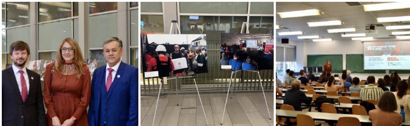
Представники УЧХ та КЧХ у Карлтонському університеті. Вересень 2024, Оттава.