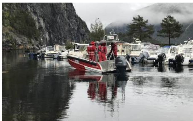
Візит делегації УЧХ до Норвезького ЧХ. Жовтень 2024, Осло.