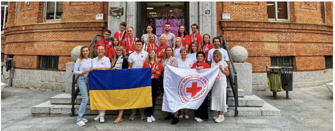
Делегація УЧХ під час візиту до штаб-квартири ІЧХ. Вересень 2024, Мадрид.

Іспанський Червоний Хрест відіграє важливу роль у вдосконаленні організаційної спроможності Українського Червоного Хреста, з фокусом на волонтерському менеджменті та залученості молоді, у шести ключових сферах: розвиток волонтерства і молоді, навчання тренінгам, інституційна участь, залучення молоді, перехід до нових форм волонтерства та діджиталізація. У вересні 2024 року інституційний візит до штаб-квартири Іспанського ЧХ у Мадриді дозволив обом національним товариствам обмінятися стратегіями щодо інтеграції волонтерів, мобілізації ресурсів та залучення молоді. Для УЧХ це була можливість на власні очі спостерігати, як Іспанський ЧХ долучає волонтерів у кожен аспект своїх операцій та почерпнути для себе цінні уроки, що можна застосувати в Україні.