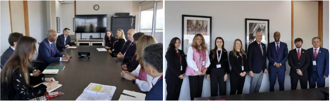
Представники УЧХ та КЧХ на зустрічі з міністром з міжнародного розвитку Канади. Вересень 2024, Оттава.

19 вересня з метою підвищення видимості гуманітарного реагування УЧХ в Україні на запрошення сенатора українського походження Стена Кутчера, сенаторки Донни Даско та Ратни Омідвар відбувся парламентський сніданок. У заході також взяли участь представники федерального уряду, включно з 5 депутатами Паламенту та 11 сенаторами, зокрема тими, хто займаються питаннями закордонних справ, міжнародного розвитку та реагування в Україні.