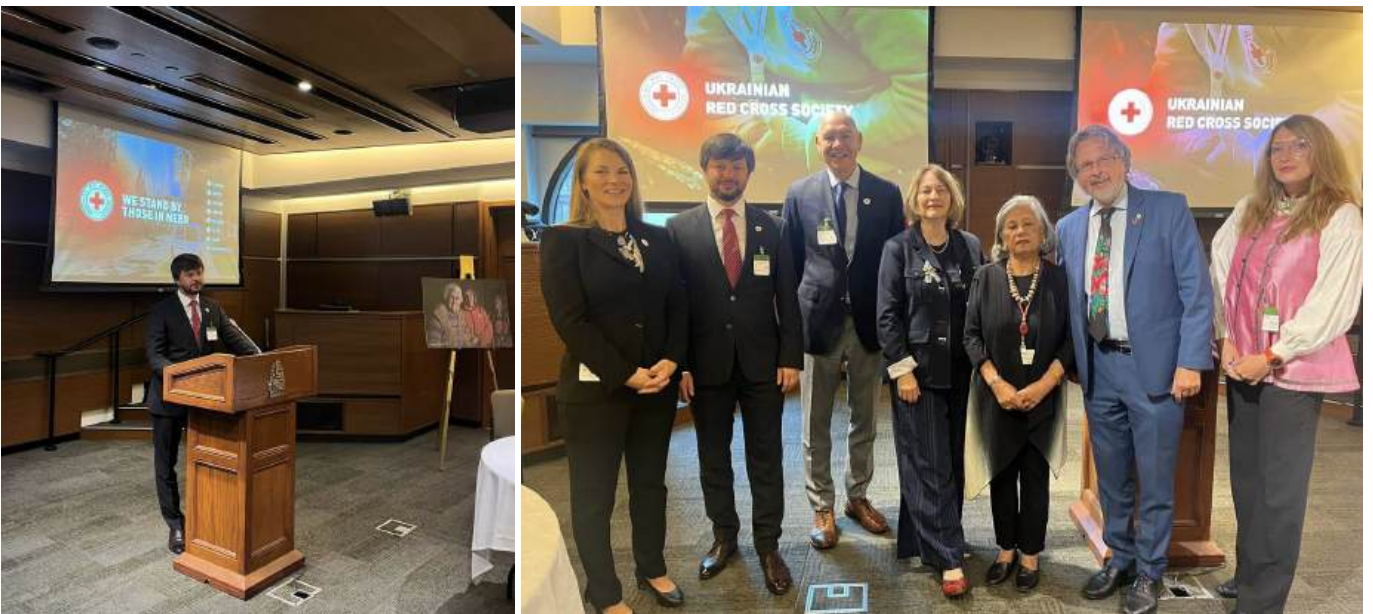
Представники УЧХ та КЧХ на парламентському сніданку. Вересень 2024, Оттава.

19 вересня з метою підвищення видимості гуманітарного реагування УЧХ в Україні на запрошення сенатора українського походження Стена Кутчера, сенаторки Донни Даско та Ратни Омідвар відбувся парламентський сніданок. У заході також взяли участь представники федерального уряду, включно з 5 депутатами Паламенту та 11 сенаторами, зокрема тими, хто займаються питаннями закордонних справ, міжнародного розвитку та реагування в Україні.