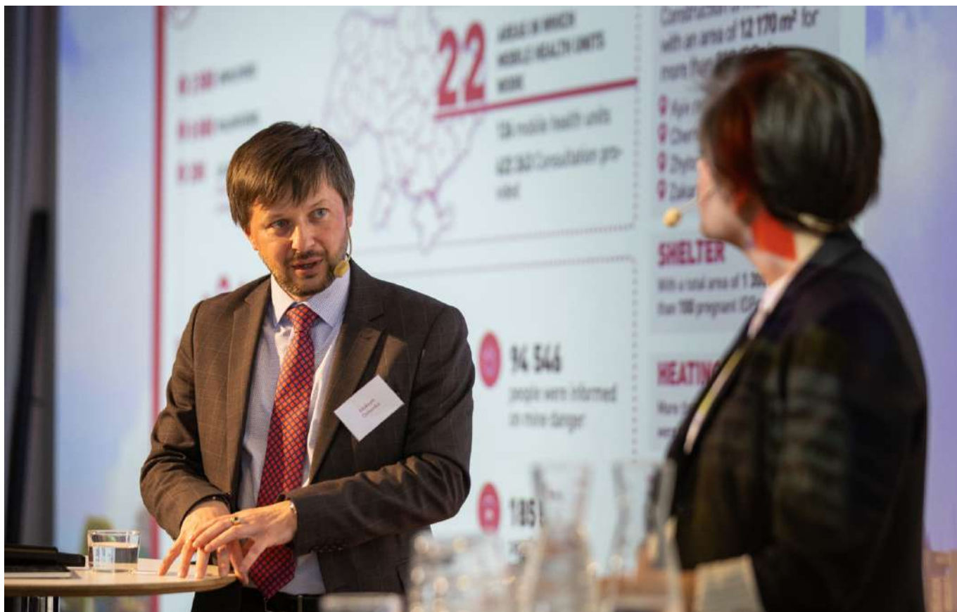
Генеральний директор Товариства Червоного Хреста України Максим Доценко на семінарі "Очіма українців". Квітень 2024, Стокгольм.

Міністр міжнародного розвитку та зовнішньої торгівлі Швеції Йохан Форссел виголосив вступну промову, у якій виділив важливість постійної підтримки України. На одній з панелей мова йшла про те, як різні сектори бізнесу можуть зробити свій внесок у спільне благо, сприяти розбудові довіри та стійкості організацій громадянського суспільства, потребі в інвестиціях у внутрішню бухгалтерію, прозорості, підзвітності та диджиталізації. Директор Стокгольмського центру східноєвропейських досліджень Фредерік Лейдквіст зазначив, що країнам, які підтримують Україну, бракує загальної узгодженої стратегії, а політика щодо України потребує трьох основних компонентів: зближення з ЄС та відбудови, що є обопільно необхідними передумовами для України, аби досягти успіху, а також безпеки України, що превалює над першими двома. Уряд Швеції доручив Директору Академії Фольке Бернадотт Перу Ольссон Фрідху, разом із Шведським міжнародним агенством з розвитку співробітництва та Шведським інститутом, реалізувати Стратегію співробітництва у сфері відбудови та реформ в Україні на 2023-2027 роки. Він підкреслив, що розвиток в Україні не є лінійним, усі процеси повинні відбуватися паралельно. Процес вступу до ЄС – мирний процес, напрямок до змін, проте важливо забезпечити, щоб сьогоднішня діяльність з підвищення темпів економічного зростання, розвитку соціально важливої інфраструктури та соціальних аспектів демократичного врядування не відбувалися ізольовано.