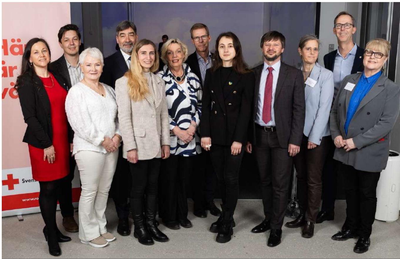
Представники Червоного Хреста України та Шведського Червоного Хреста на семінарі "Очима українців". Квітень 2024, Стокгольм.

Семінар також відвідали колишній міністр закордонних справ Швеції, представники Шведського агентства з питань міжнародної співпраці та розвитку, Академії Фольке Бернадотта, Шведського Агентства з цивільних надзвичайних ситуацій, національне ЗМІ Sveriges Television, компанії Volvo й Electrolux.