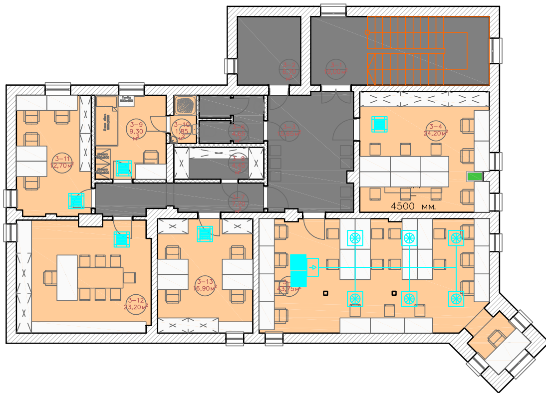
План мансардного поверху М 1:100