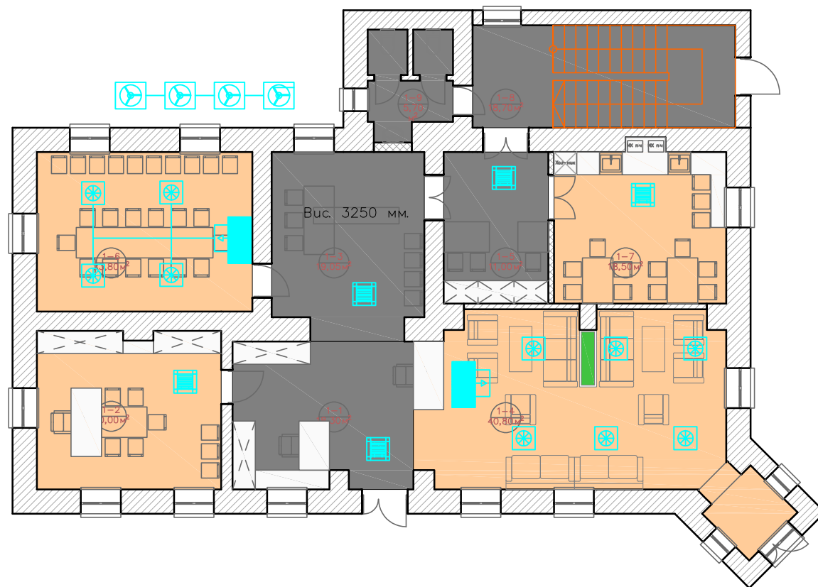
План першого поверху М 1:100