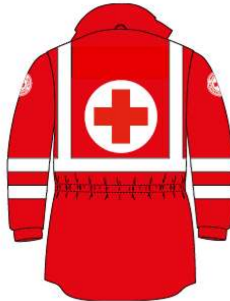
Куртка, зворотня сторона