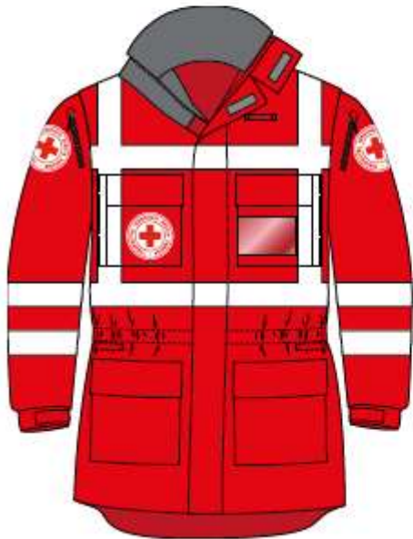
Куртка, лицьова сторона