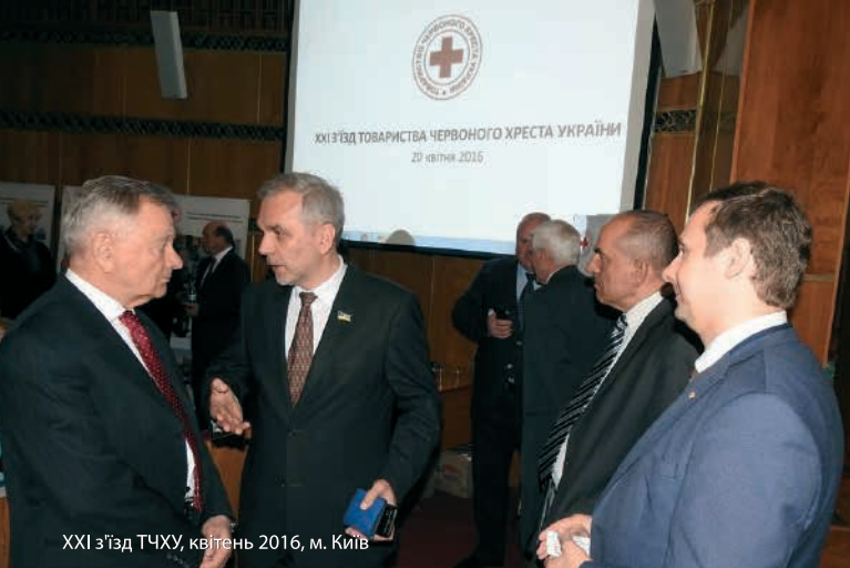
XXI з'їзд ТЧХУ, квітень 2016, м. Київ