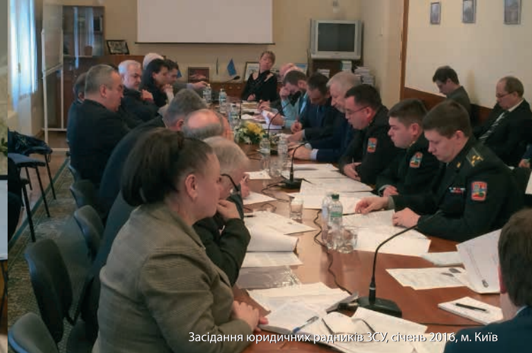
Засідання юридичних радників ЗСУ, січень 2016, м. Київ