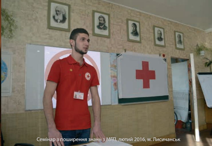
Семинар з поширення знань з МГП, лютий 2016, м. Лисичанськ